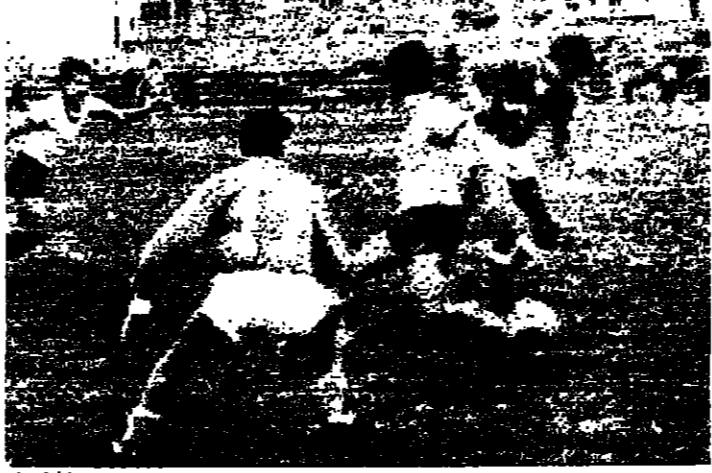
لقطة من المباراة